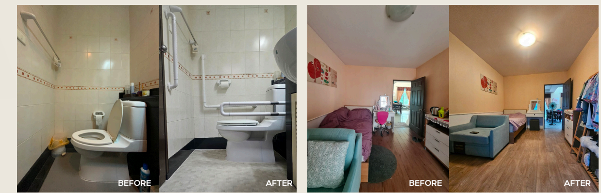
*ระยะเวลาในการติดตั้งหน้างาน

ติดตั้งอุปกรณ์เพิ่มความปลอดภัย และอำนวยความสะดวกให้กับผู้สูงอายุ ติดตั้งราวจับ อุปกรณ์ เปลี่ยนสุขภัณฑ์ ติดตั้งประตูบานเลื่อนระบบปิดกั้นอัตโนมัติ ปูพื้นลดแรงกระแทก - ห้องน้ำ ห้องนอน หรือพื้นที่ที่ใช้งานเป็นประจำ